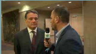
Amazon e farmaci online