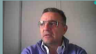
Distributori farmacia: pronta l'app di Promofarma