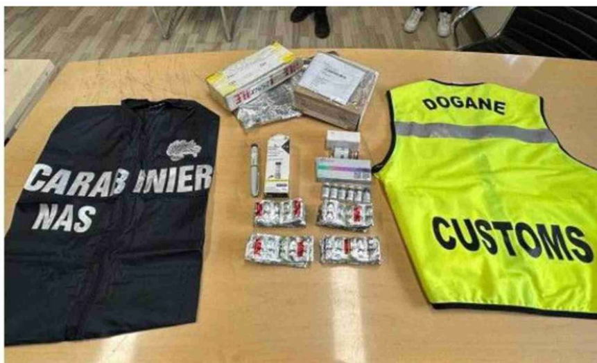
L'ultima maxi operazione internazionale Pangea contro il traffico e la vendita online di farmaci illegali ha portato al sequestro di sei milioni di medicinali contraffatti per un valore superiore ai 15 milioni di dollari