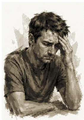
per curare la disfunzione erettile