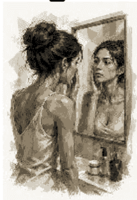
per i ritocchi estetici (come botulino)