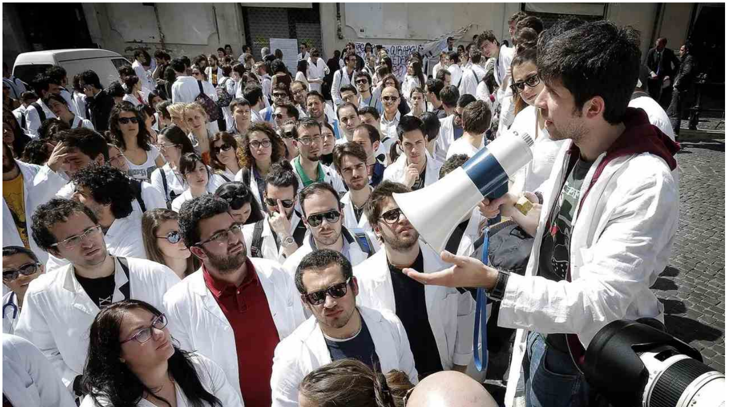
Una recente protesta dei medici dell'emergenza a Roma