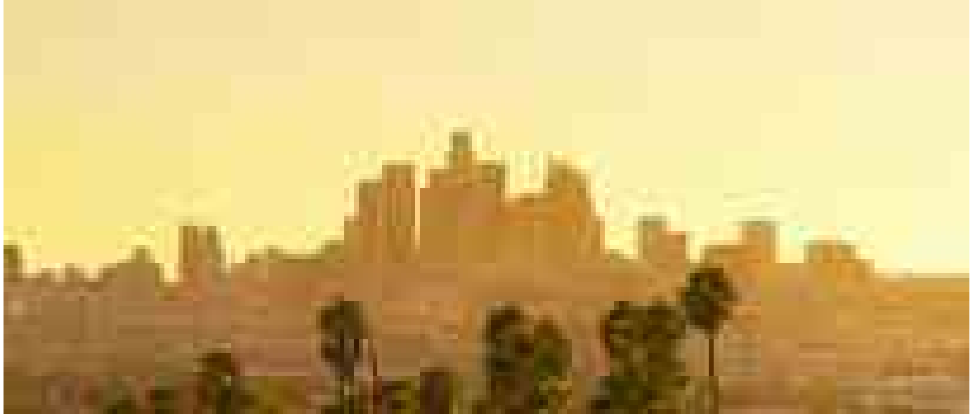
Viaggio nelle città del Mondiali di calcio