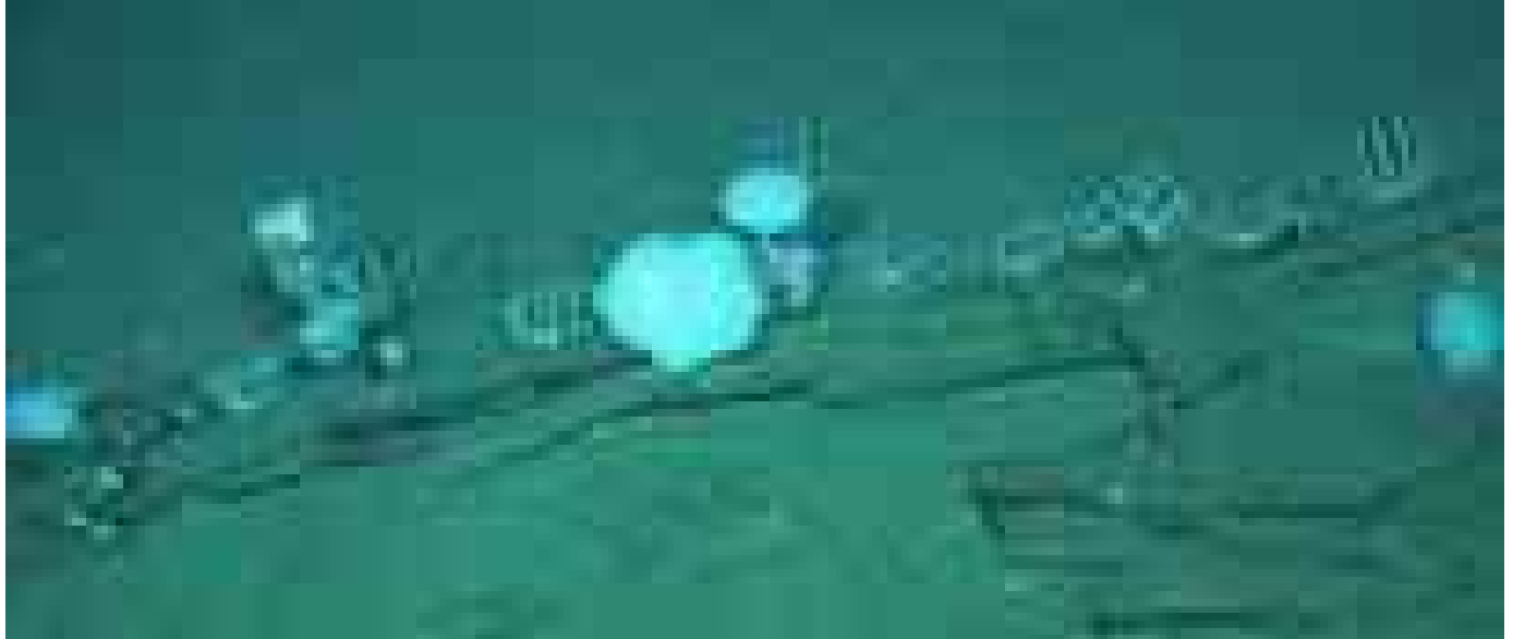
Una necropoli delle balene che ha oltre 5 milioni di anni

Temi caldi Medio Oriente Ponte sullo Stretto Mondiali 2026 Meloni Belfast SALUTE&BENESSERE / Sanità