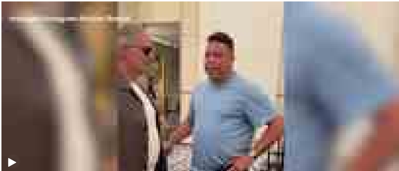
Il siparletto tra Ronaldo e Bocelli conquista i social