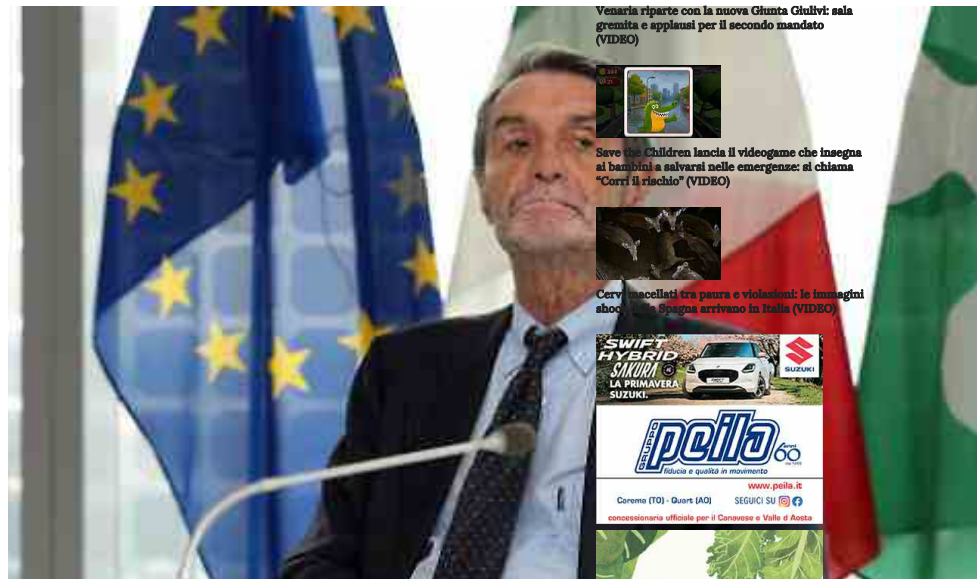
Il presidente della regione Lombardia, Attilio Fontana

Il fronte più caldo resta quello con le Regioni . Dopo il forte dissenso espresso dall'assessore al Welfare della Lombardia Guido Bertolaso , è il presidente lombardo Attilio Fontana a rincarare la dose, definendo lo stop alla riforma « una scelta sbagliata del governo ». Secondo Fontana, quella proposta era stata « sottoscritta sia dal centrosinistra che dal centrodestra », e dunque la retromarcia dell'esecutivo appare alla Lombardia come un passo indietro inatteso e politicamente difficile da comprendere.