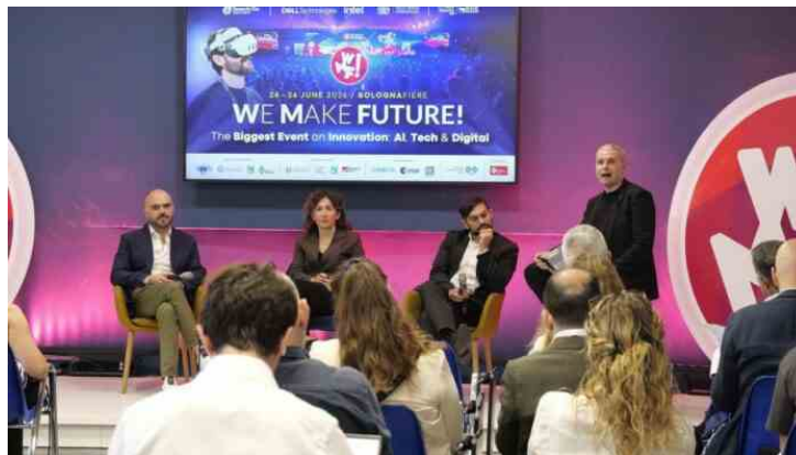
A Bologna da oltre 90 Paesi per il WMF, oltre 800 espositori e 90 stage formativi