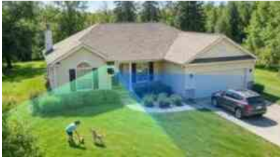
Reolink Rivoluziona La Sicurezza Smart, Arriva La Serie OMVI A Tripla Lente 9 Giugno 2026