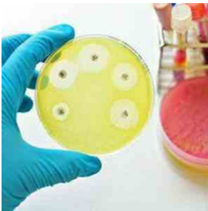
Ai E Medicina Di Precisione Per Combattere Super Batteri Resistenti, Lo Studio Italiano Su Quasi 10.000 Pazienti 9 Giugno 2026