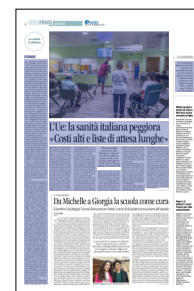
Peso: 1-1%, 4-55%

Altro dato critico: la dispersione delle ricette. Solo il 50% delle prime visite prescritte e il 54% degli esami si traduce in prestazioni erogate. In pratica, una ricetta su due si perde. Secondo Agenas, «una quota di mancata presa in carico tra 25% e 30% può essere fisiologica, il resto necessita di approfondimenti». Per il presidente dell'Associazione Chirurghi ospedalieri italiani, Vincenzo Bottino, «quando la media delle ricette utilizzate è così bassa significa che una parte rilevante della domanda esce dal perimetro pubblico». In alcune aree, precisa, «il fattore tempo è decisivo» e i pazienti provvedono nel privato perché «una colonscopia tardiva può cambiare la storia clinica».