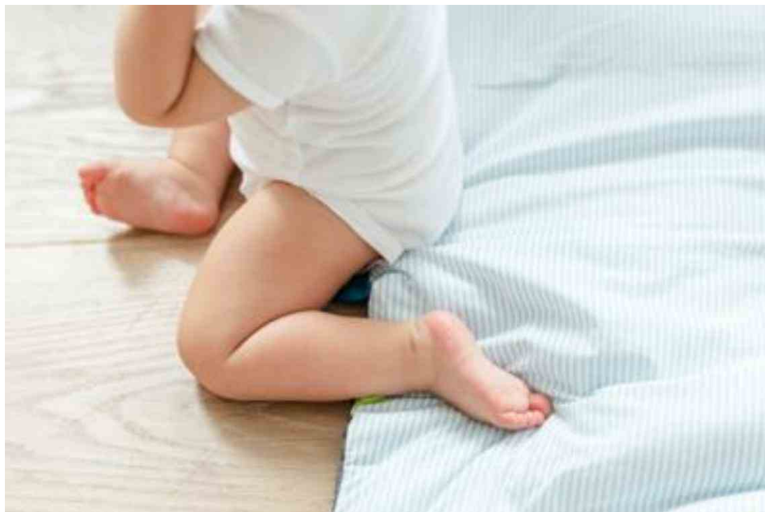
Pediatri - archivio