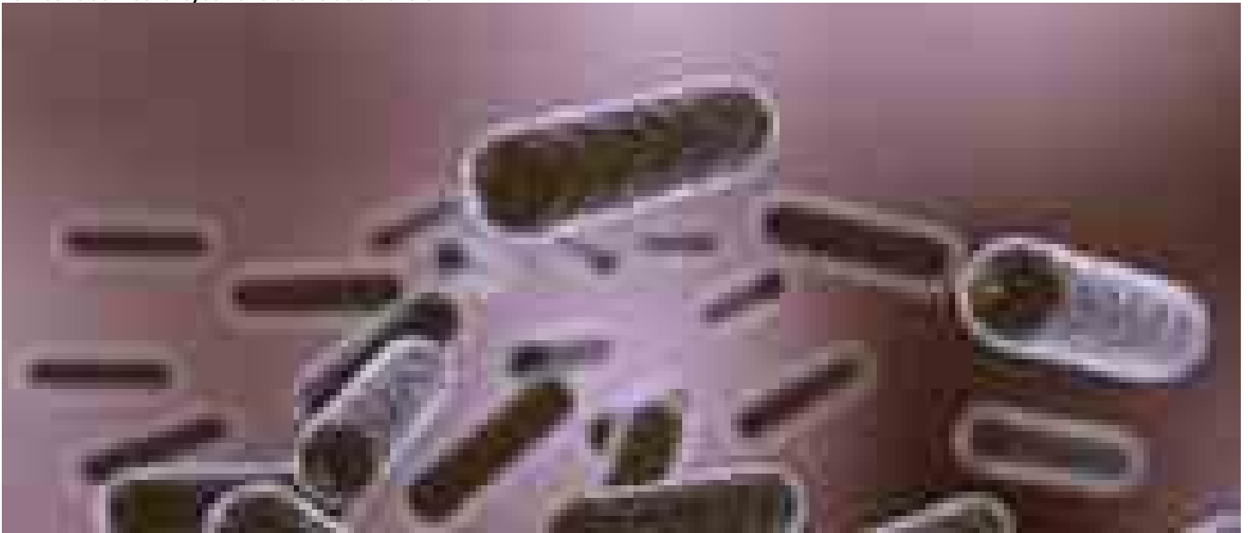
Un batterio aiuta a non riprendere i chilli persi