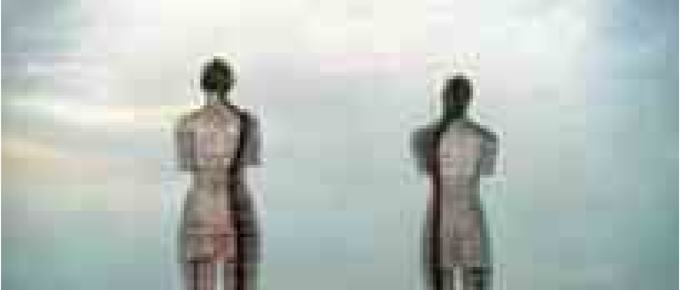
Le mostre del weekend, da Lotto e Savoldo a Manara