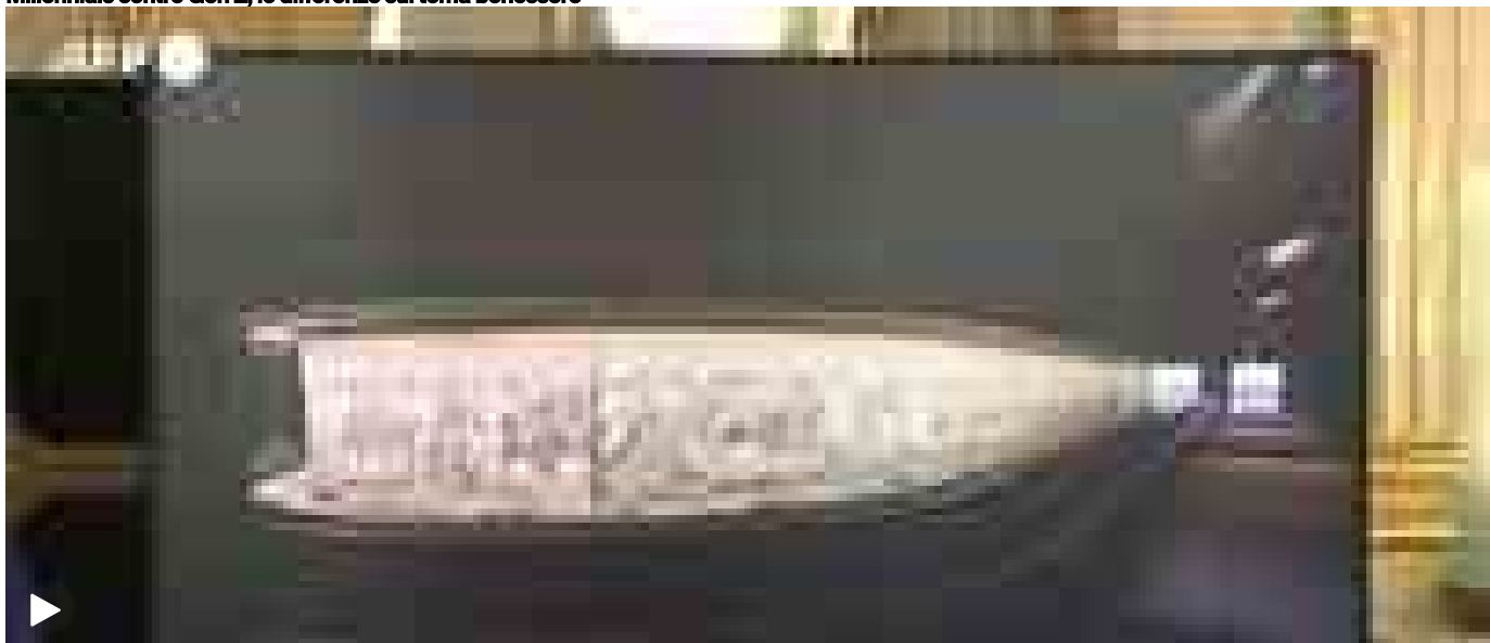
Il prezioso Arazzo di Bayeux in viaggio verso Il British Museum