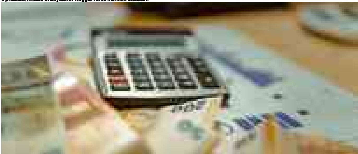
Modello 730 2026: Il punto sulla dichiarazione dei redditi tra scadenze, rimborsi e nuove regole

Responsabilità editoriale a cura di Teleborsa