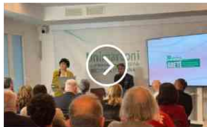
Università UniMarconi celebra i 10 anni della rivista scientifica internazionale Areté