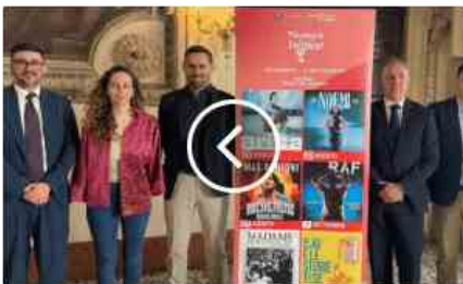
Vicenza in Festival 2026: Arisa, Noemi, Raf, Madame ed Elio e le Storie Tese in Piazza dei Signori