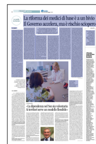
Peso: 1-2%, 8-50%

Per la Federazione dei medici di medicina generale, infatti, «la riunione si è conclusa ancora una volta senza una soluzione condivisa e non è ancora chiaro se l'urgenza reale sia raggiungere gli obiettivi del Pnrr legati alle Cdc o creare un canale di dipendenza per i medici di medicina generale». La Fimmg, però, aveva ribadito la «disponibilità a collaborare attraverso strumenti negoziali più rapidi ed efficaci rispetto a un percorso legislativo», ma ieri ha comunque rinnovato le critiche con un manifesto che recita: «Oggi 19 maggio è la Giornata mondiale del medico di famiglia. La riforma vuole fargli la festa». Permangono delle criticità - in primis il debito orario da colmare e la retribuzione legata agli obiettivi - anche secondo il Sindacato medici italiani (Smi) che, in stato di agitazione, ha indetto una