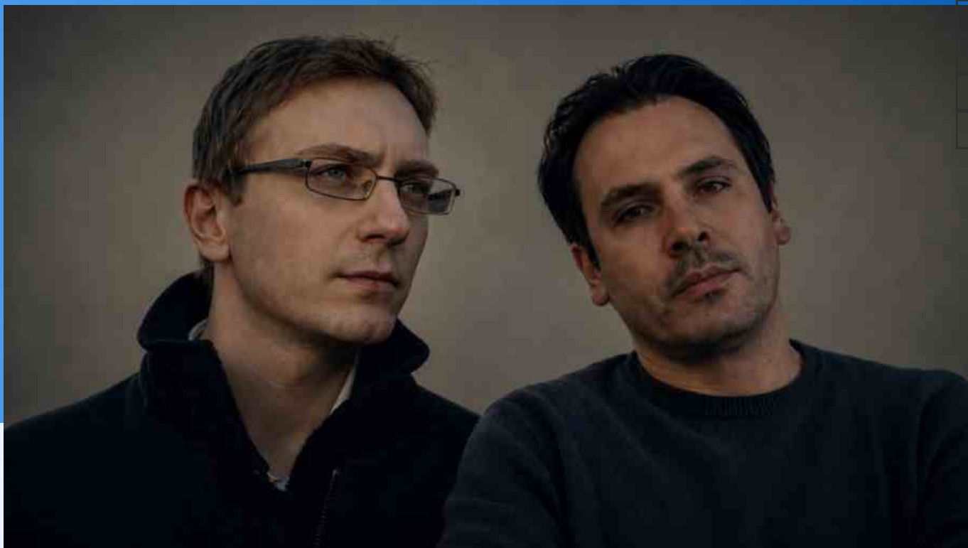
Immagine generata da AI tramite GPT Image 1.5 di OpenAI