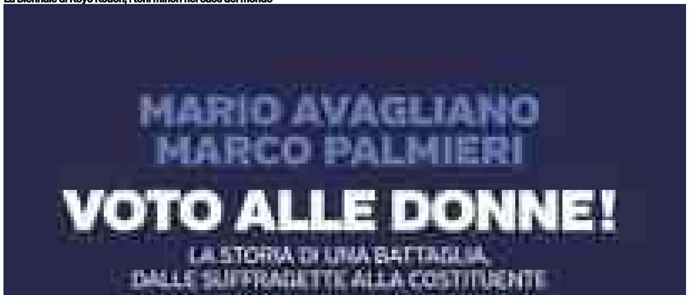
Voto alle donne, la lunga storia della battaglia per i diritti