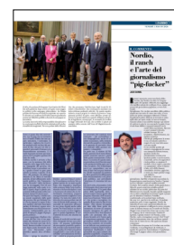
Peso: 4-28%, 5-27%

L'ultima novità è arrivata a fine anno, con la sentenza 204 della Consulta sulla legge della Toscana, impugnata dal governo, che stabilisce tempi e procedure certe. I giudici hanno in gran parte salvato la norma e sancito «il diritto» del paziente, che abbia già ottenuto il via libera al suicidio assistito, di fare affidamento sulla sanità pubblica. Ma l'interpretazione "discordante" della decisione non ha incoraggiato l'iter di una legge nazionale, sulla quale è calato il sipario dopo le parole pronunciate dalla premier nella conferenza stampa di inizio anno. Per quel che trapela, i dubbi van-