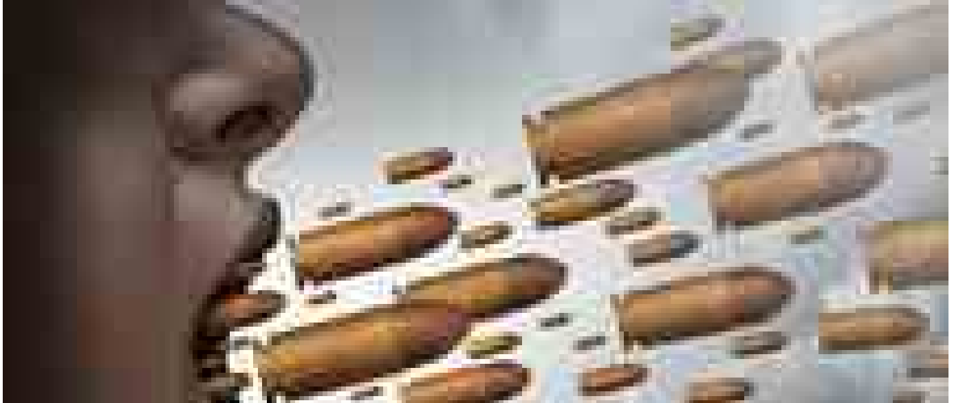
La rete dell'odio online, così diventa virale

Temi caldi Iran Libano Trump Hormuz Papa Leone / SALUTE&BENESSERE / Sanità