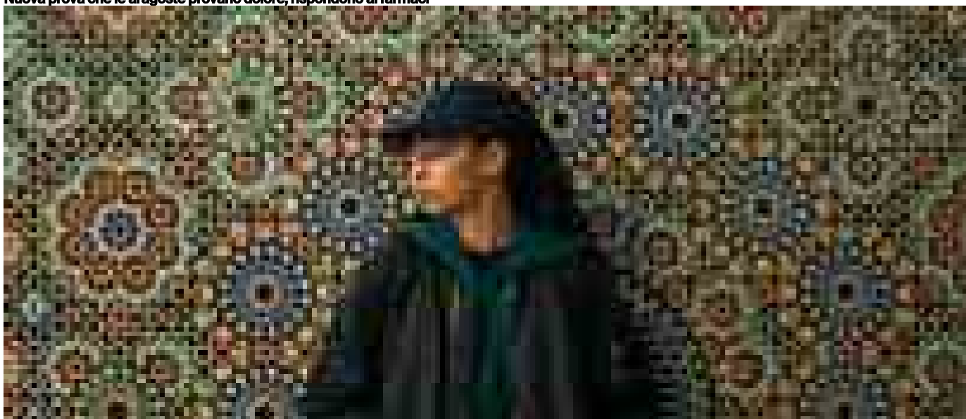
'La più piccola' premiata a Cannes, in Italia è stato vietato ai minori di 14 anni