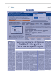
Peso: 1-4%, 10-94%

L'iniziativa ha coinvolto tutti i 23.882 professionisti sanitari e ha raccolto oltre 30.000 questionari di gradimento, dai quali emerge una valutazione media complessiva ottima. I corsi sono stati resi disponibili nel gennaio del 2025 e lo saranno fino alla fine del progetto prevista per giugno 2026. —