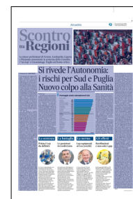
Peso: 1-7%, 7-66%