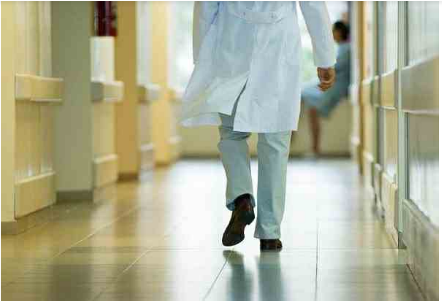
dottore in corsia

Home > Bologna > Sanità, fascicolo sanitario elettronico: Emilia-Romagna prima regione in Italia