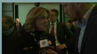
Lorenzin. Governance del farmaco e piena realizzazione