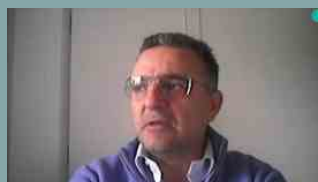
Distributori farmacia: pronta l'app di Promofarma