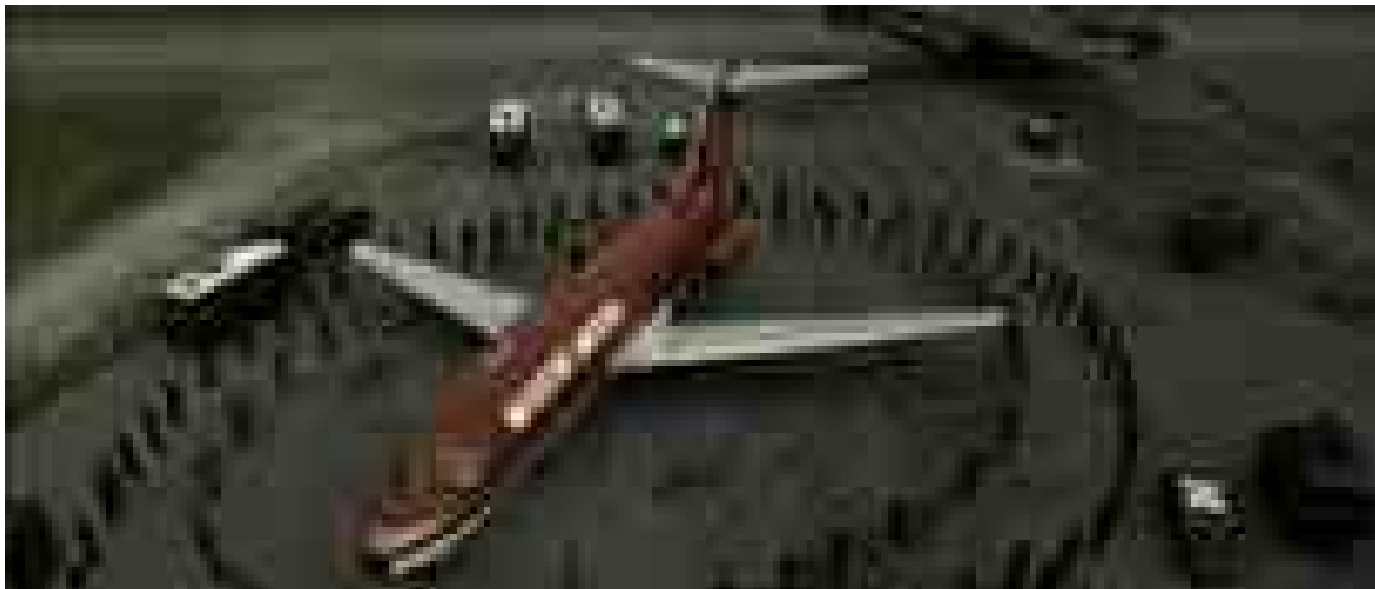
Cosa accadde Il 10 ottobre 1985 a Sigonella