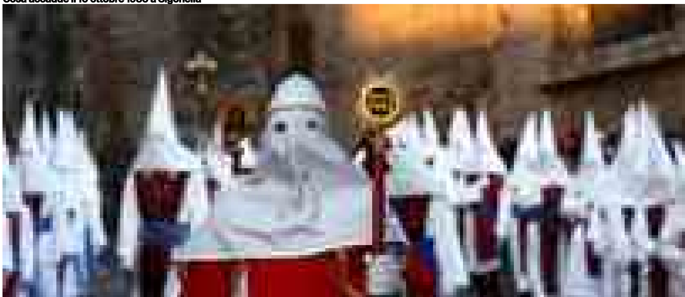
Pasqua In Sicilia tra riti, processioni e sapori