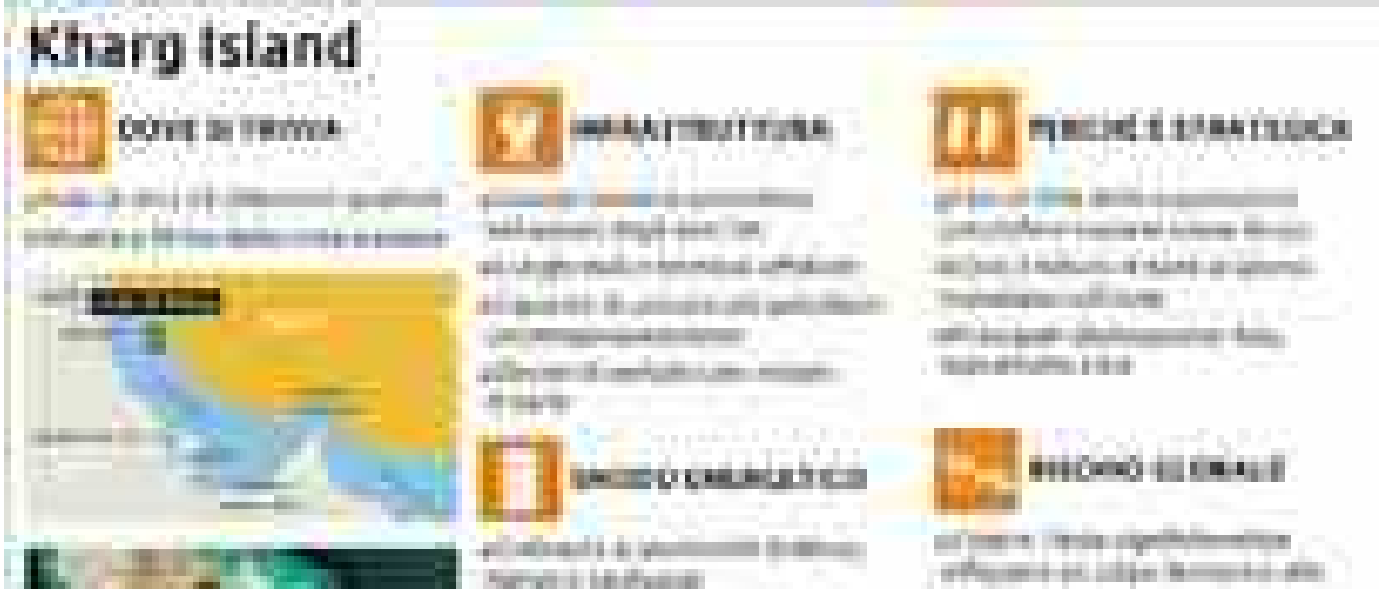
Kharg, l'isoletta del Golfo cruciale per il petrolio iraniano