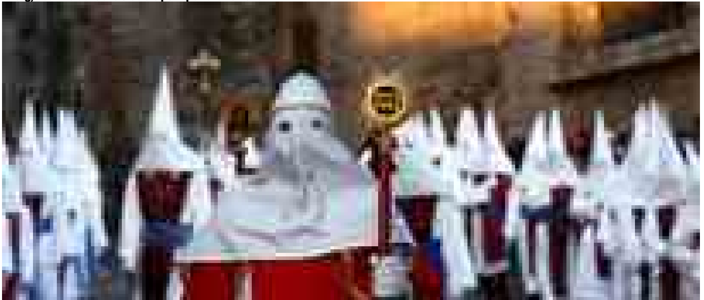
Pasqua in Sicilia tra riti, processioni e sapori