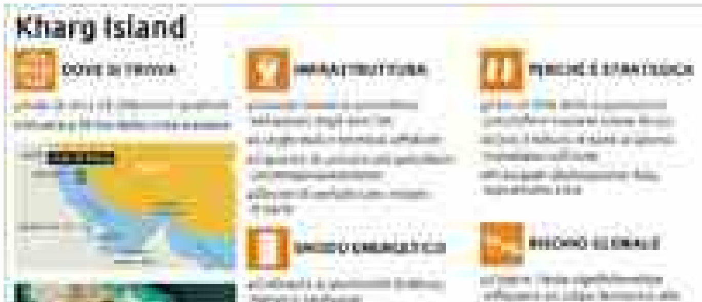
Kharg, l'isoletta del Golfo cruciale per il petrolio iraniano