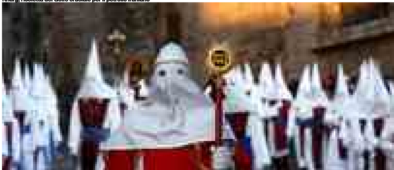
Pasqua in Sicilia tra riti, processioni e sapori