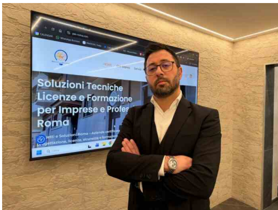
Roma, il labirinto burocratico frena le imprese

'Senza conoscenza del territorio si rischia il fallimento'