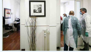
Emergenza medici di famiglia

24 Marzo 2026 alle 05:00 2 minuti di lettura