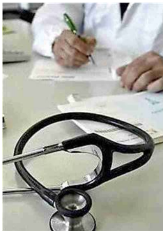
PUNTO DI RIFERIMENTO I MEDICI DI BASE SONO UN PRESIDIO SOPRATTUTTO NEI PICCOLI COMUNI

La Regione ha stanziato 4,5 milioni di euro per le borse di specializzazione in medicina generale