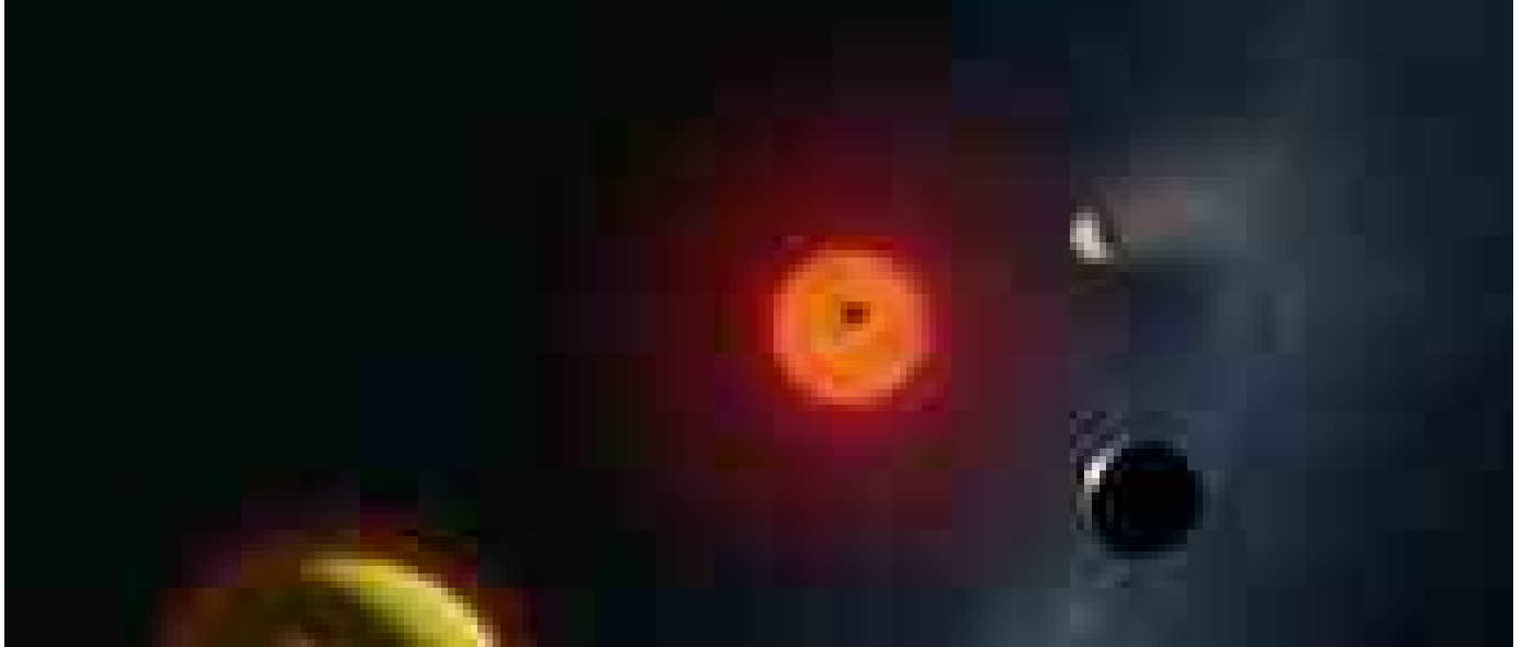
Nè rocciosi nè gassosi, scoperti i pianeti fusi con oceani di magma