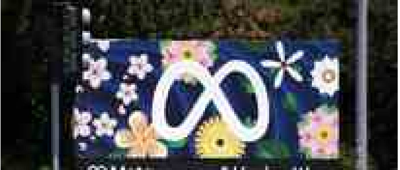
Meta rafforza impegno nell'IA, maxi accordo da 27 miliardi con Nebius