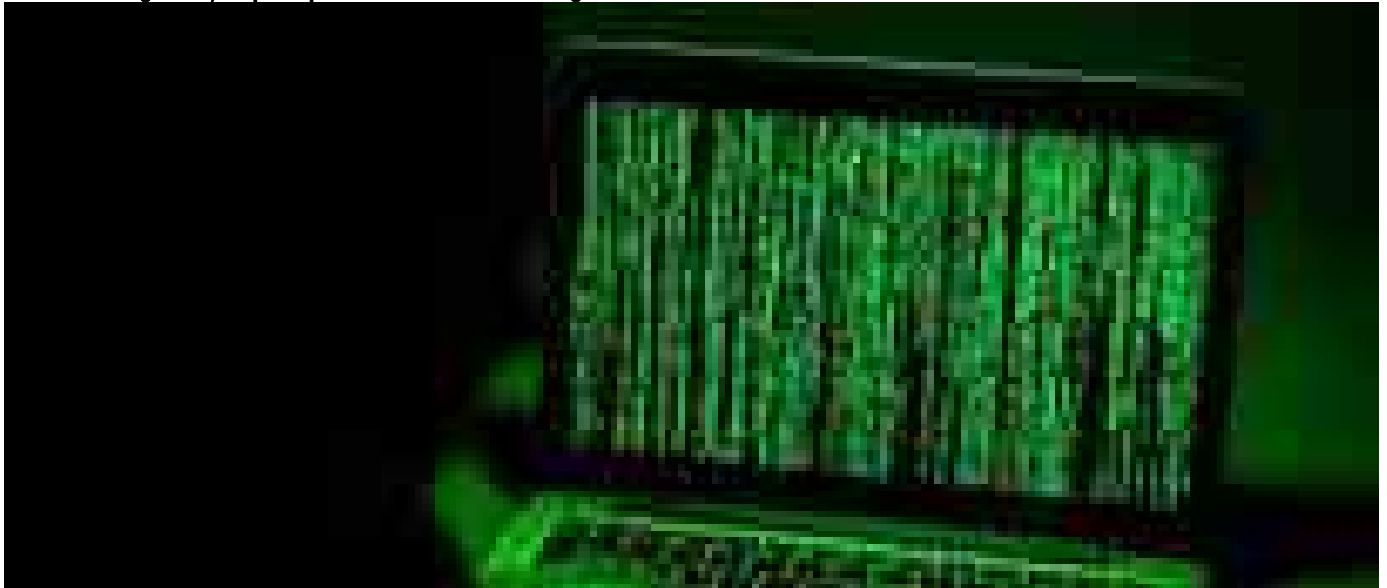
In Italia 2.500 cyberattacchi ogni settimana, superata la media globale

Temi caldi Iran, Homuz, Referendum, Oscar, Sinner / Regione Trentino AA/S