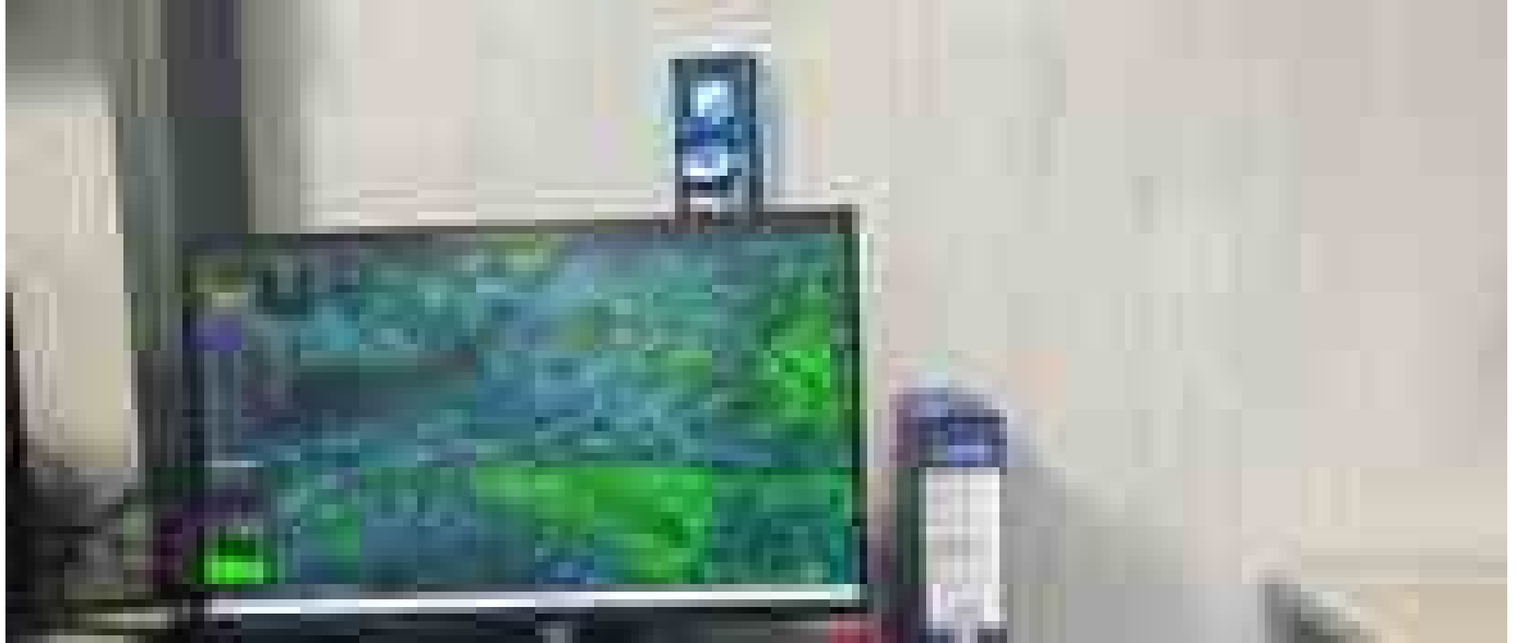
Una 'mappa GPS' delle cellule tumorali per potenziare l'immunoterapia

TemilIranLarjaniSoleimaniHormuzReferendum / Regione Abruzzo