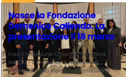
NAPOLI - Il prossimo 18 marzo sarà presentata alla stampa la Fondazione Domenico Caliendo. La costituzione legale avverrà alle 18 a Napoli, in...