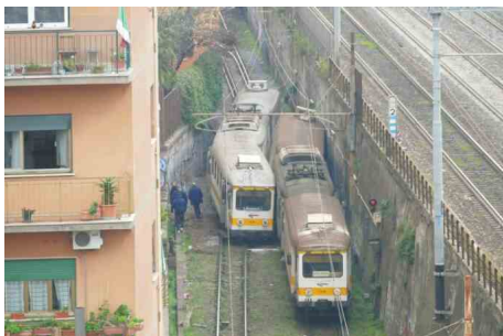
Termini-Centocelle ferma dopo lo scontro tra convogli: nessuna data per la riapertura della linea