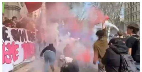
Sciopero transfemminista a Roma, protesta davanti al Ministero dell'Istruzione: vernice rossa e fumogeni