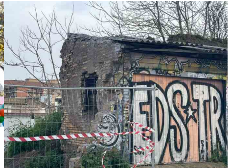
Tuscolana, nuovo muro lungo i binari: lavori per 80 giorni ma l'area resta degradata