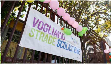
Municipio X, nuove strade scolastiche per mettere in sicurezza gli studenti: pronta alla chiusura al traffico