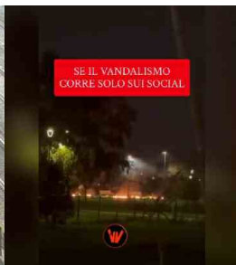
Garbatella, bottiglie incendiarie nel parco: il video finisce sui social