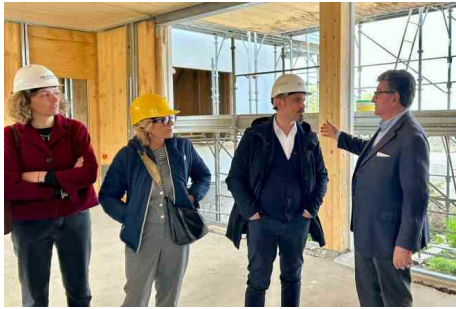
Valle Muricana, prende forma la nuova scuola: nido e infanzia per 120 bambini nel quartiere