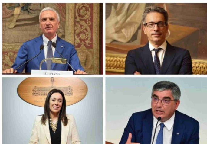
Al Cnpr forum il punto sulla sanità pubblica tra sostenibilità e diritti

risorse. Le questioni principali da affrontare sono due. La prima riguarda la necessità di ripensare complessivamente il sistema sanitario affinché rimanga equo, solidale e universale, rimettendo al centro il ruolo delle professioni sanitarie e rivedendo il peso della politica nelle scelte programmatiche e organizzative. La seconda riguarda la gestione delle emergenze sanitarie e sociali, sempre più frequenti, improvvise e spesso violente, alle quali è indispensabile garantire risposte rapide ed efficaci". Le notizie del sito Dire sono utilizzabili e riproducibili, a condizione di citare espressamente la fonte Agenzia DIRE e l'indirizzo https://www.dire.it