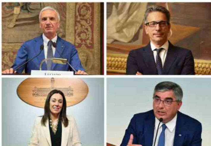
Cnpr forum: "Sanità pubblica tra sostenibilità e diritti"