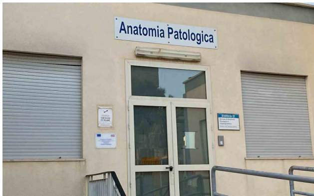
L'Anatomia patologica di Trapani