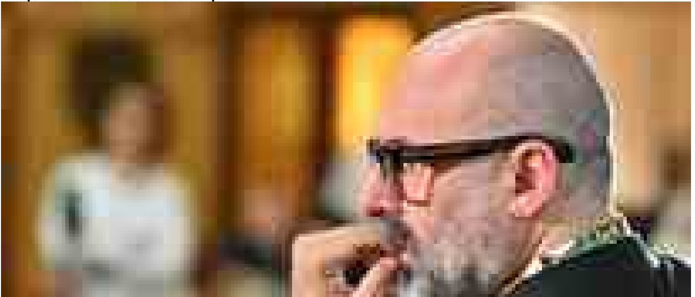
Da Lis a biglietto sospeso, il Nazionale di Genova diventa 'Teatro senza barriere'