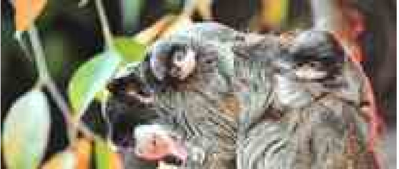
Al Bioparco di Roma sono nati due tamarini Imperatore