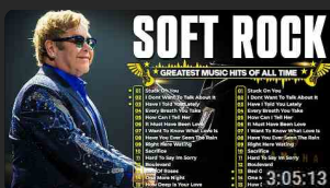
Elton John, Rod Stewart, Phil Collin... 562K visualizzazioni