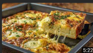
La Frittata di Patate al Forno Più Fil... 572 visualizzazioni