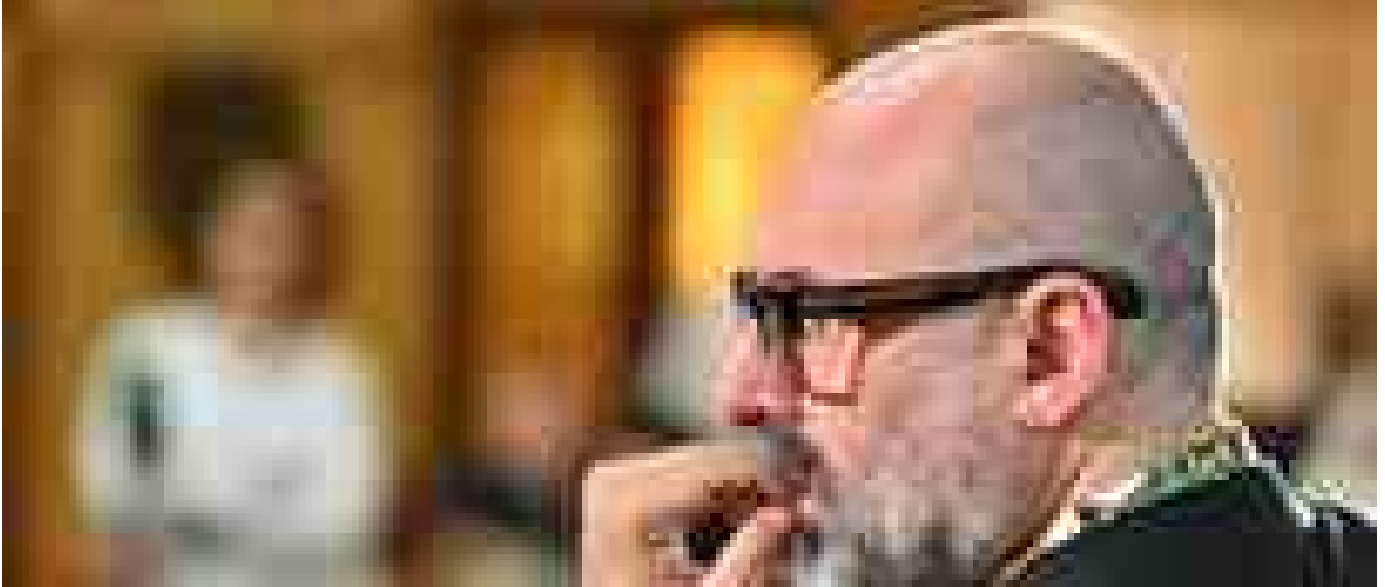
Da Lis a biglietto sospeso, il Nazionale di Genova diventa 'Teatro senza barriere'