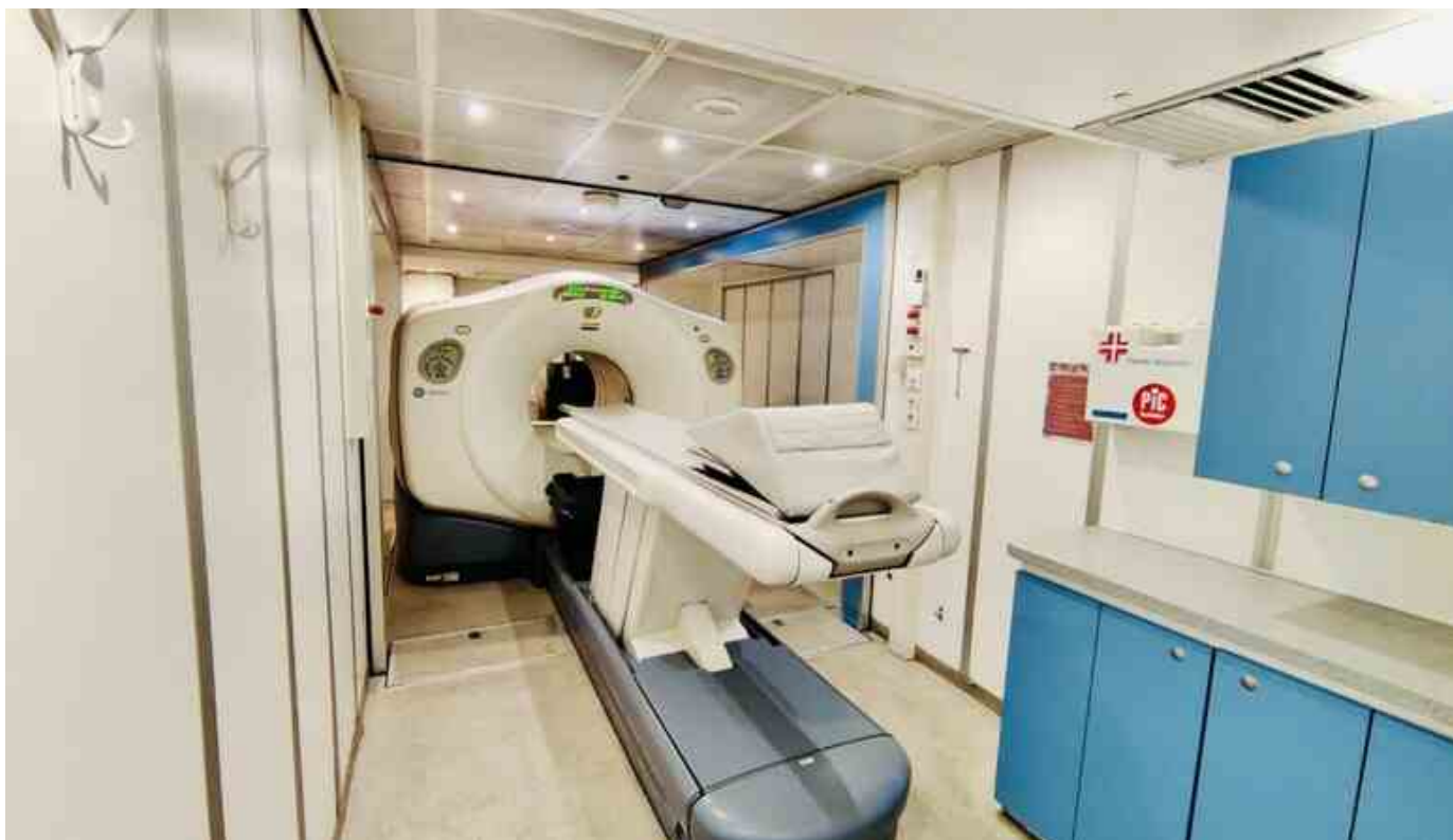
↑ - RIPRODUZIONE RISERVATA

N el 2023 il saldo della mobilità sanitaria della Valle d'Aosta è di -12,8 milioni di euro, in aumento di 0,89 milioni rispetto al 2022. Lo rivela il report indipendente sulla mobilità sanitaria interregionale nel 2023 realizzato da Gimbe. I crediti sono stati 15.004.802 di euro mentre i debiti ammontano a 27.842.607 di euro. Inoltre, la Valle d'Aosta si colloca in 17a posizione con le strutture private che erogano il 15,7% del valore totale della mobilità sanitaria attiva regionale (media Italia 54,5%).