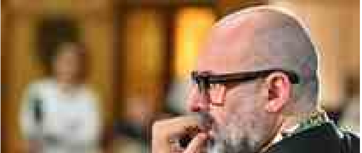
Da Lis a biglietto sospeso, il Nazionale di Genova diventa 'Teatro senza barriere'