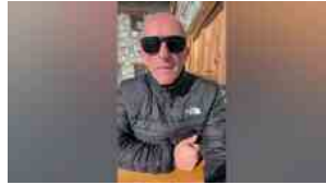
▶ Morti sospette in ambulanza, l'appello dei figli di una delle vittime