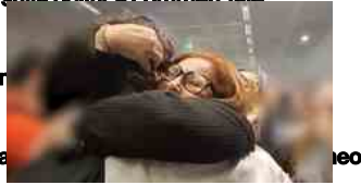
▶ Studenti rientrati dagli Emirati a Malpensa, "siamo a casa"