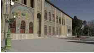
▶ Danneggiato lo storico palazzo del Golestan a Teheran, patrimonio mondiale dell'Unesco