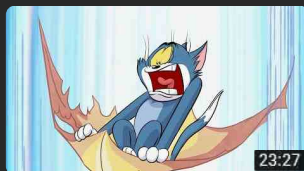
TOM VE JERRY #YENİ Çizgi Film | ... 90 Mln di visualizzazioni