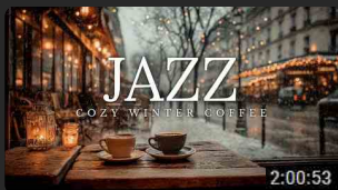
Jazz Invernale Accogliente | Atmo... 961K visualizzazioni