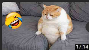
Try Not To Laugh Funniest Cats &... 193K visualizzazioni