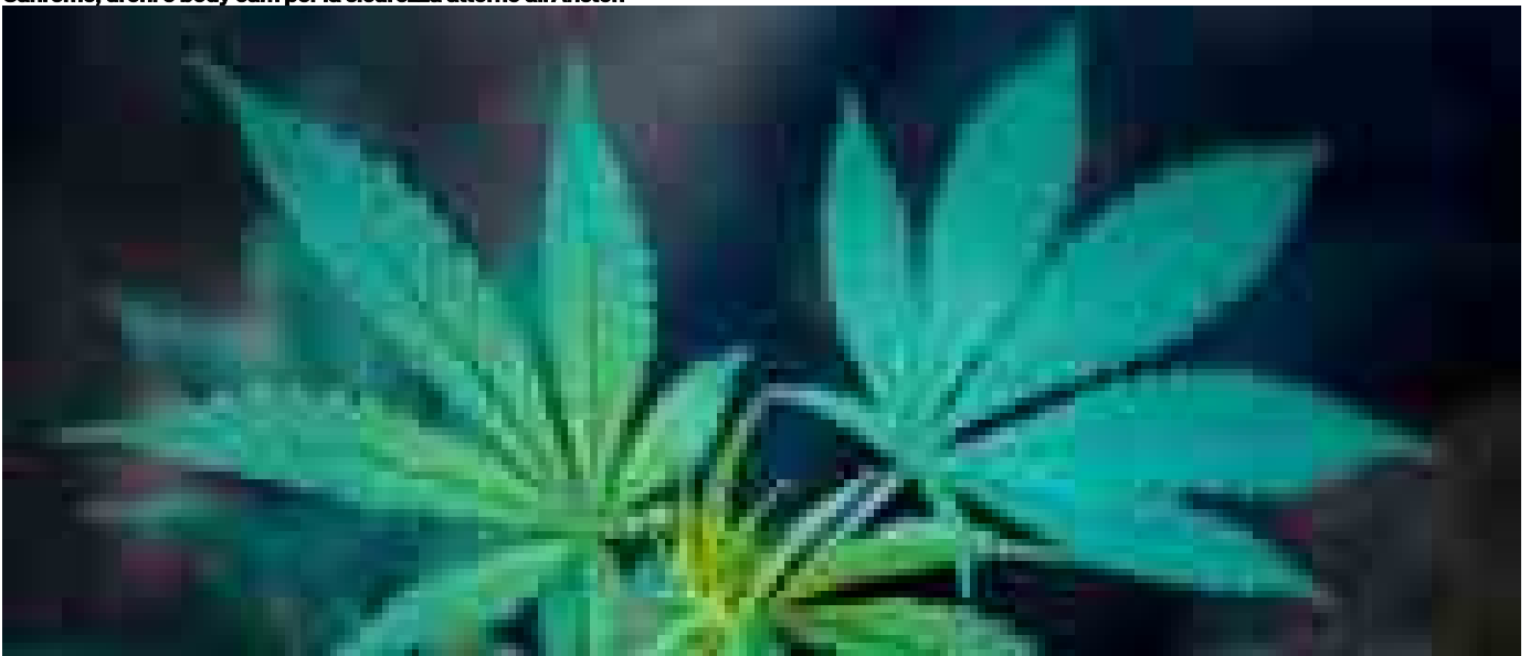
Riportato in vita un enzima della cannabis attivo milioni di anni fa