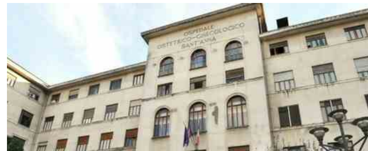
Una foto d'archivio dell'ospedale Sant'Anna di Torino

Fondazione Onda ETS ha assegnato 3 Bollini Rosa all'ospedale torinese