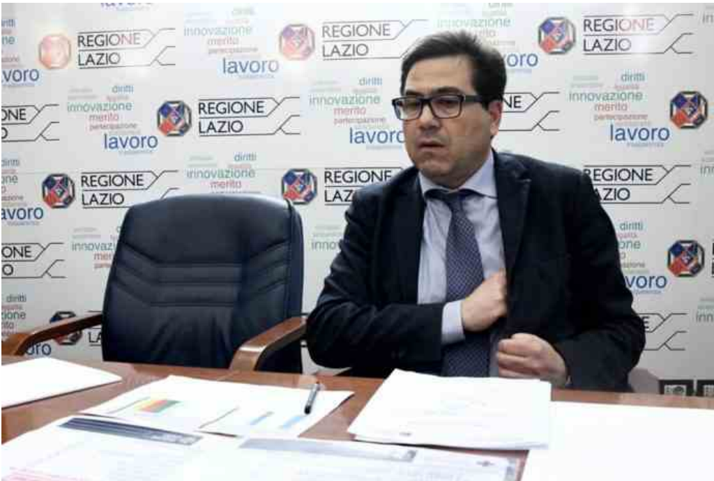
L'assessore alla Sanità della Regione Lazio, Alessio D'Amato, durante la conferenza stampa straordinaria in giunta regionale, sull'emergenza coronavirus