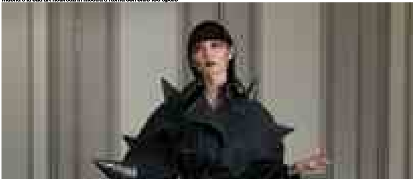
Psicanalisi e abiti, come ci vestiamo dipende da Freud