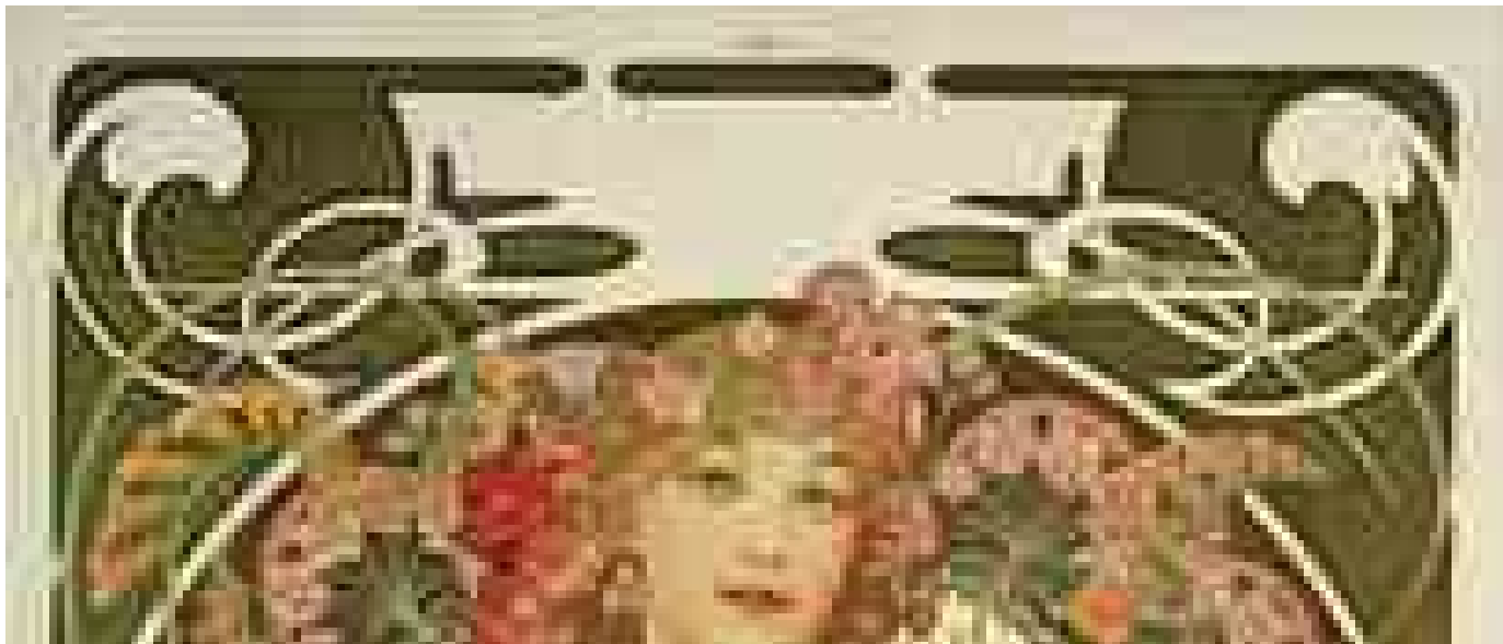
Mucha e la sua art nouveau In mostra a Roma con oltre 150 opere